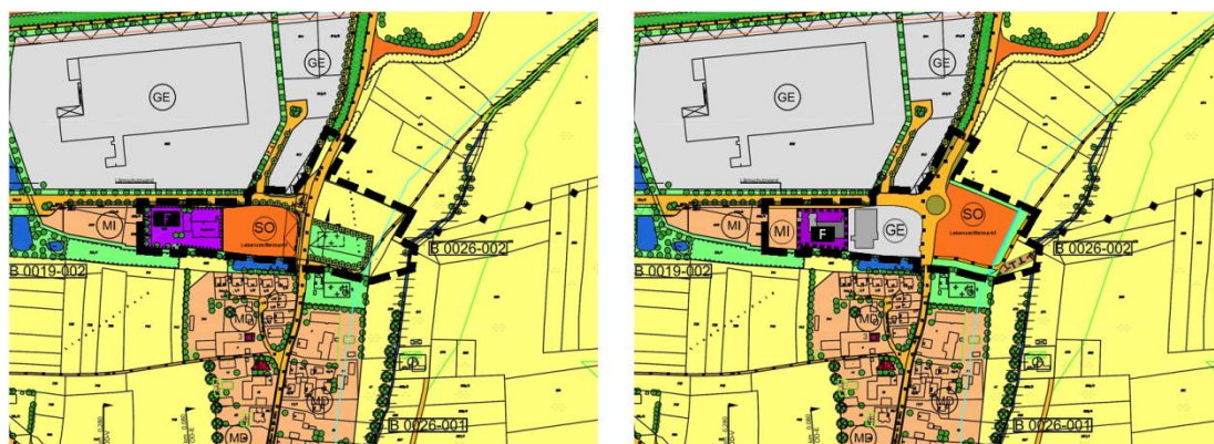
Abb. 3: Geltungsbereich Süd: Rechtswirksamer FNP der Gemeinde Anzing in der Fassung vom 05.06.2012 inklusive der 1. Änderung in der Fassung vom 01.04.2014 (links) und der vorliegenden 3. Änderung (rechts, im Parallelverfahren)

Im Osten des Ortes verläuft durch das Biotopverbundprojekt Sempt-Schwillach-Tal, das im rechtskräftigen FNP als nachrichtliche Übernahme dargestellt ist.