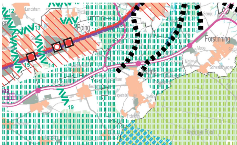
Abb. 2: Auszug aus Karte 2 „Siedlung und Versorgung“ des Regionalplans München – ohne Maßstab

Der Regionalplan enthält im Kapitel Wirtschaft und Dienstleistungen folgende relevante Grundsätze und Ziele: